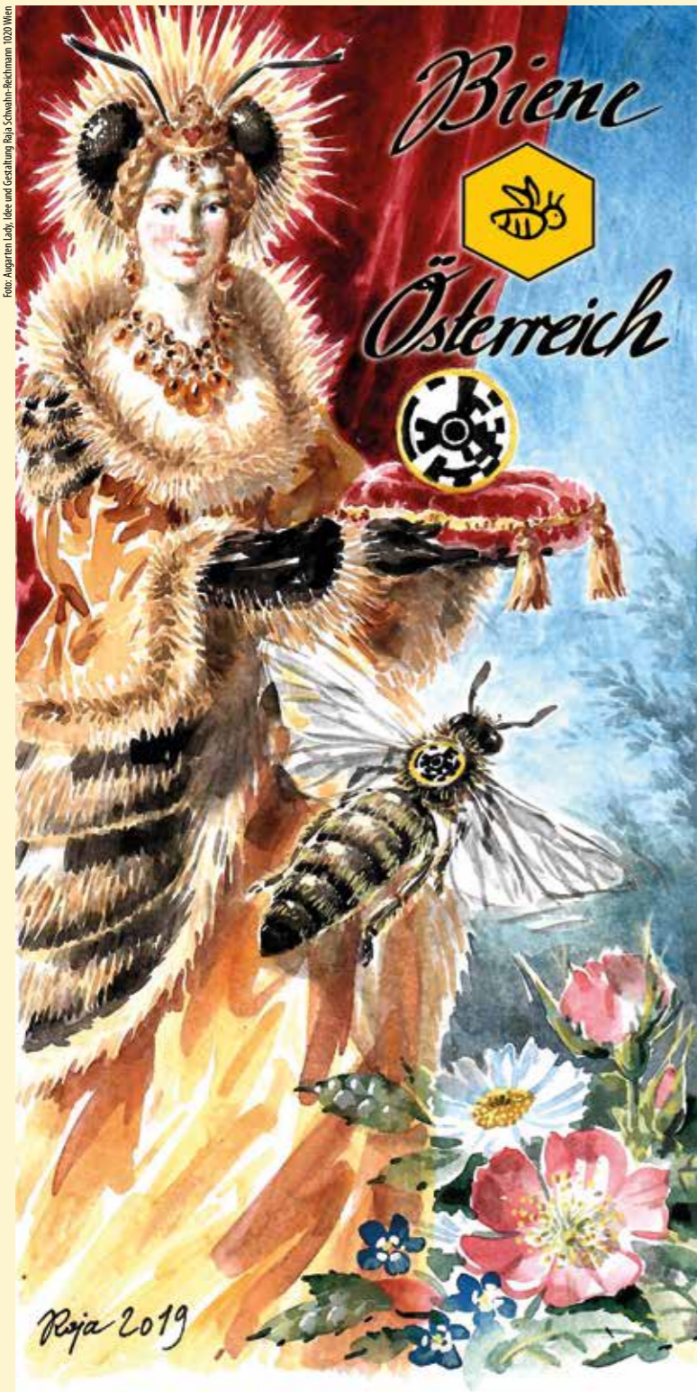
Foto: Augarten Lady, Idee und Gestaltung Rita Schwahr-Reichmann 1020 Wien