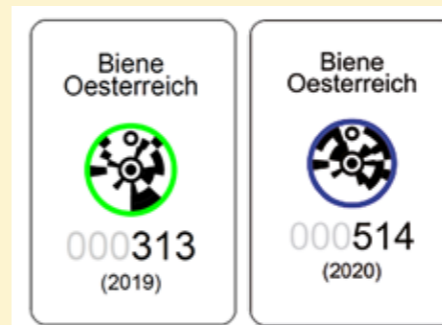
Der Sticker 2019 2020

Der Züchter liefert die codierten Königinnen immer mit einem Sticker aus, welches die gleiche Kontrollnummer besitzt. Er generiert diese Sticker selbst nach Bedarf.